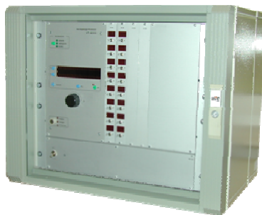
Leergehäuse für Bedieneinheit VP-9000 ausbaufähig für bis zu 8 Verriegelungs- modulen FE-262/0. Inkl. abschließbarer Fronttür, Netzteil, Blindplatten