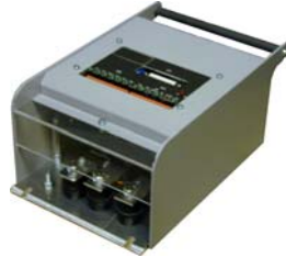
geschlossen mit Haube

Belastungsdiagramme für Thyristorsteller bitte separat anfordern.